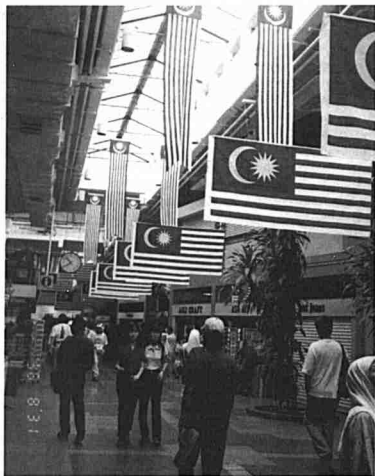
◀ Sambutan Hari Kebangsaan di Malaysia disambut meriah dengan penuh semangat patriotik.

Komanwel di Victoria '94, Kanada, kita hanya menduduki tempat ke-13 dengan dua emas, satu perak dan dua gangsa. Lebih manis lagi pencapaian itu melepasi ramalan yang ditetapkan Majlis Sukan Negara (MSN) dan Majlis Olimpik Malaysia (MOM), sebelum temasya sukan setiap empat tahun itu bermula.